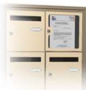
Tableau d'affichage intégré dans le bloc. (occupe 1 case du bloc)