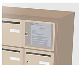
Tableau affichage intégré occupe 1 case